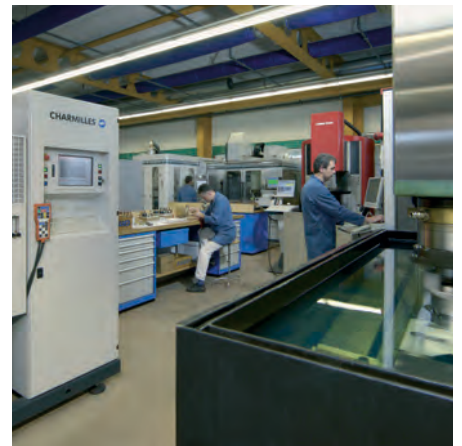
Erodiermaschinen mit Automatisierung.