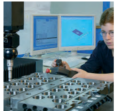
Höchstpräzision insbesondere im Medizin-Sektor.