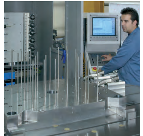
Hohe Fertigungstiefe bei KEBO AG.